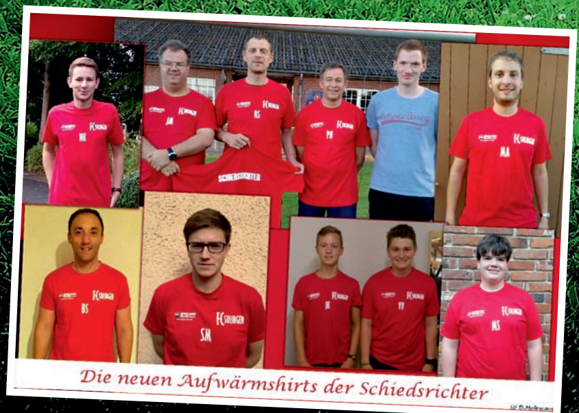
Die neuen Aufwärmshirts der Schiedsrichter