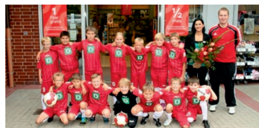
U14 Kreisliga Süd Diepholz