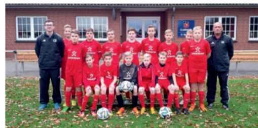
U15 Kreiskliga Süd Diepholz