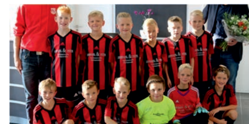
U12 Kreisliga Süd Diepholz